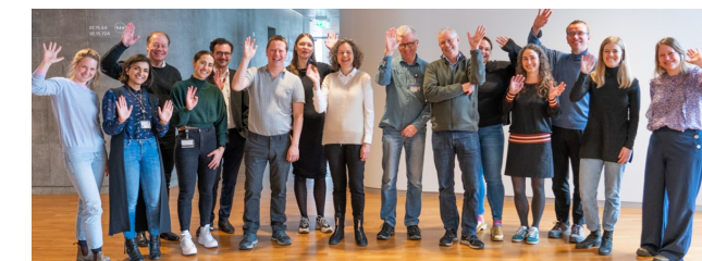
TRANSLATE arbejdsgruppen Et samarbejde mellem: